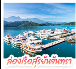
ล่องเรือสุริยันจันทรา

ล่องเรือชมทะเลสาบสุริยันจันทรา (SUN MOON LAKE) ชมเกาะลาลู แคว-วัดสวนทอง • อิสระเดินเล่น หมู่บ้านอิต้าซ่า • นั่งรถไฟเล็กโบราณ (1 สถานี) สัมผัสบรรยากาศเส้นทางรถไฟสายธรรมชาติ • ตะลุย ไทจงไม้ไผ่ยักษ์ แหล่งรวมแฟชั่นและสตรีทฟู้ด • ช้อปปิ้งย่าน ซิเหมินตง (XIMENDING) ถ่ายรูปแลนด์มาร์ค ตึกไทเป 101 • ช้อปปิ้งกังทงที่ MITSUI OUTLET PARK ชมความสวยงามของ อนุสรณ์สถานเจียงไคเช็ค • ขอพรความรักที่ วัดหลงซาน ชมโคมหินเสียดรณีที่นี่ที่ เย่หลิว • ชมบรรยากาศเมืองเก่าที่ จิวเฟิน