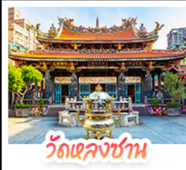
วัดเจหลงซาน