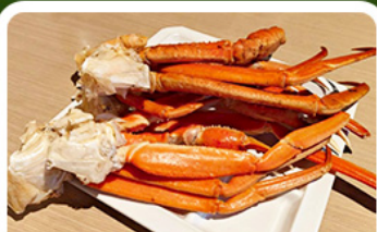
เมนูพิเศษ! ซาซิมิ