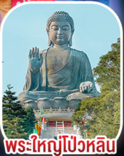
พระใหญ่โป้วหลิน