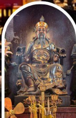
วัดปักไต้ เสริมโชคกลางนำความรุ่งเรืองทุกด้านของชีวิต