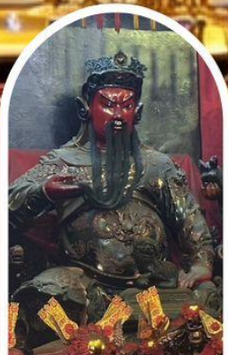
วัดกวนไท่ ขอเทพเจ้ากวนอู ความซื่อสัตย์ เงินทอง ธุรกิจมั่นคง