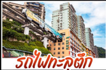
รถไฟฟ้าความเร็วสูง