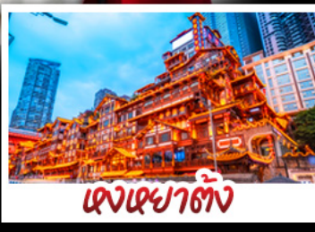
แดนเฉาตัง