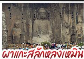
พลาแกะสลักหลงเหมิน

เที่ยวครบ 4 มรดกโลก ถ้ำหลงเหมิน - สุสานจีนซีฮ่องเต้ - วัดเส้าหลิน หมู่บ้านไต้คินसानโจว - หมู่บ้านกัวลี้ยงชุน