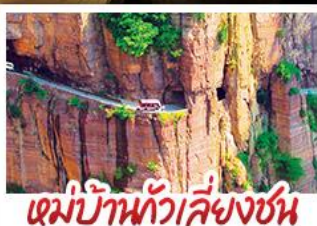
หมู่บ้านกัวลี้ยงชุน