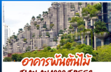
อาคารพันต้นไม้อาณาจักร TIAN AN 1000 TREES