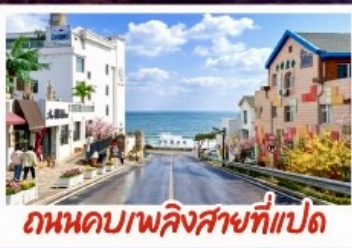
ถนนคาวบอยที่สายที่แปด