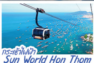
กระเช้าไฟฟ้า Sun World Hon Thom