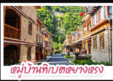
หมู่บ้านทิบตหยางหงซา

ตะลุยเจียงตู คูหิมะต้ากู่ปิงชาน ชวนเช็กอินแพนด้ายักษ์ พักใจที่หยดน้ำดาสีฟ้า! แวะชิลเมืองโบราณลั่วไต้ สัมผัสบนดัสเน่ห์ หมู่บ้านทิบตหยางหงซาต่อ สัมผัสความหนาวเย็นที่ อู๋ชานสวรรค์ธารน้ำแข็งต้ากู่ปิงชาน แหล่งรวมวิวหลักล้าน ตื่นตากับแสงสียามค่ำคืน หยดน้ำดาสีฟ้า ณ สะพานหนานเฉียว เมืองดูเจียงเจียงน ก่อนปิดท้ายด้วยการช้อปปิ้งจุใจ ถนนชุนซีลู่-ไท่กู่หลี่ และเซะภาพกับ แพนด้าเซลฟี่ สุดคิวท์