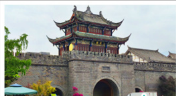
เมืองโบราณกวนเซี่ยน

ภูเขาสี่ดรุณี - อุทยานน้ำตึงโกว - สะพานหนานเฉียว ร้านหนังสือจงซูเก้อ - เมืองโบราณกวนเสียน จตุรัสหย่างเทียนหู่ - หมีแพนด้าเซลฟี่ ถนนโบราณชอยกว้างชอยแคบ - ถนนคนเดินไท่กู่หลี่ ถนนคนเดินซุนซี - ถนนโบราณจินหลี่ แพนด้ายักษ์ปิ่นตึก - น้ำพุไม้ไผ่ตึกSKP - วัดต้าอ้อ