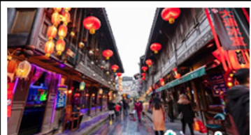
ถนนโบราณจินหลี่