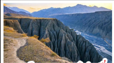
แกรนด์แคนยอนตุ่ซ่านจื่อ

ทะเลสาบโซหลี่มู่ - คานาสือ แกรนด์แคนยอนตุ่ซ่านจื่อ ตลาดแกรนด์บาชาร์ - หมู่บ้านเหมอมู่