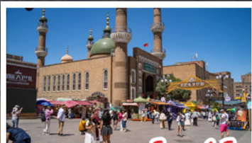
ตลาดแกรนด์บาชาร์