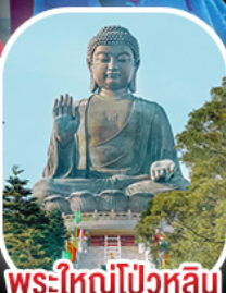
พระใหญ่โป้วหลิน