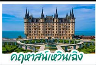
อุทยานสาขาน้ำจืด

เมืองท่าชิงเต่า - ฤดูหิมะเหนือเมือง เบียร์ชิงเต่า + อาหารทะเล สตรีทอาร์ต สตูดิโอจิบลิ