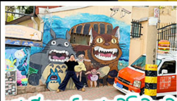
สตรีทอาร์ต สตุตโตอิจิบลิ