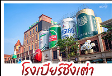
โรงเบียร์ชิงช้า