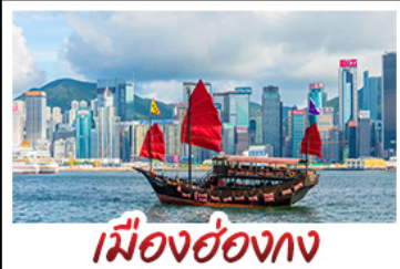
เมืองฮ่องกง

เมืองเก่าชิงช้า - วิวเมืองฮ่องกง โรงเบียร์ชิงช้า - ท่าเรือชาวประมงเชียงใหม่