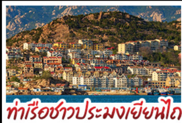
ท่าเรือชาวประมงเชียงใหม่