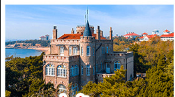
ป่าด้ากวน

พระราชวังฤดูร้อน - วิวเมืองซิงเต่า รถไฟความเร็วสูง - ภูเขาเหลาซาน กำแพงเมืองจีนด่านจวิยงกวน - ป่าด้ากวน พักโรงแรมระดับ 4 ดาว - ไม่หลงร้อน! มือพิเศษ เปิดปักกิ่ง , หม้อไฟซีฟู้ด