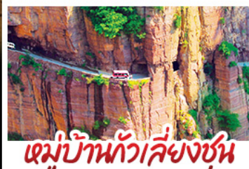
หมู่บ้านทิวาลัยชุน