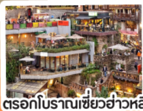
ตรอกโบราณเขี้ยวอาวหลี่