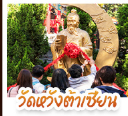
วัดเข่งต้าเซียน