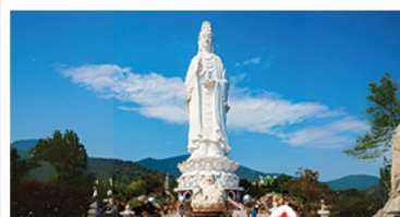
วัดหลินอิ่ง