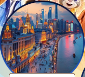
หาดไต้หวัน