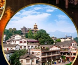
เมืองโบราณฉือฉีโป่ว