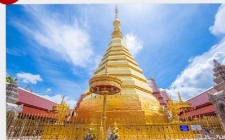
วัดพระธาตุช่อแฮ