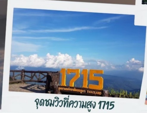
จุดชมวิวที่ความสูง 1715