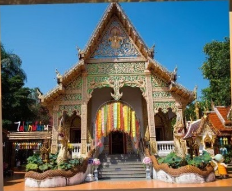
วัดศรีมงคล