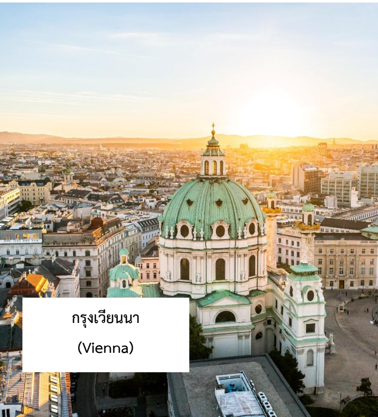
กรุงเวียนนา (Vienna)

เมนูพิเศษ!!! กลูซซูป อาหารประจำชาติฮังการี