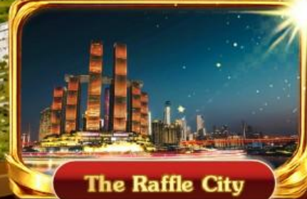
The Raffle City