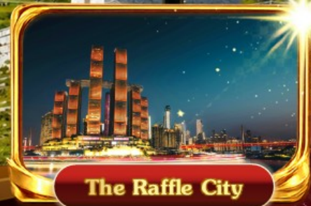
The Raffle City