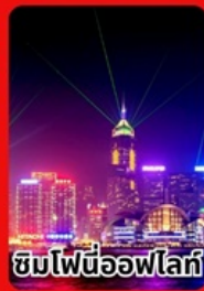
ชมไฟนีออนไฟท์