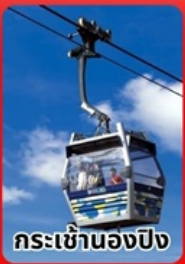
กระเช้าฮ่องกง