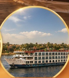
ล่องเรือแม่น้ำไนล์