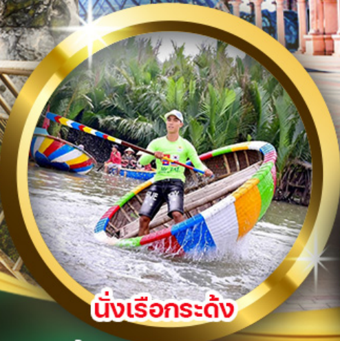
นั่งเรือกระดิ่ง