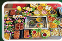
ปิ้งย่าง BBQ