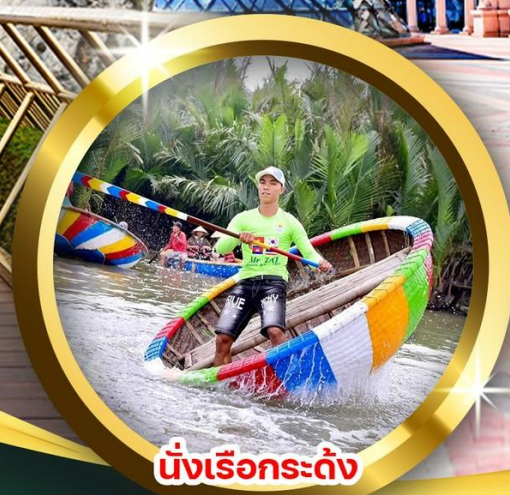
นั่งเรือกระดิ่ง