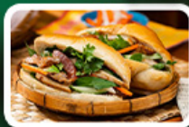
“บั้นหมี่”