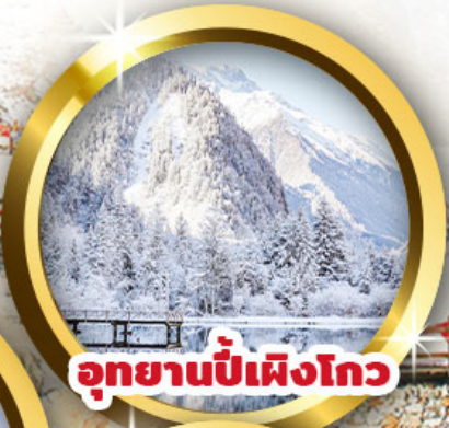
อุทยานปี้เฟิงโกว