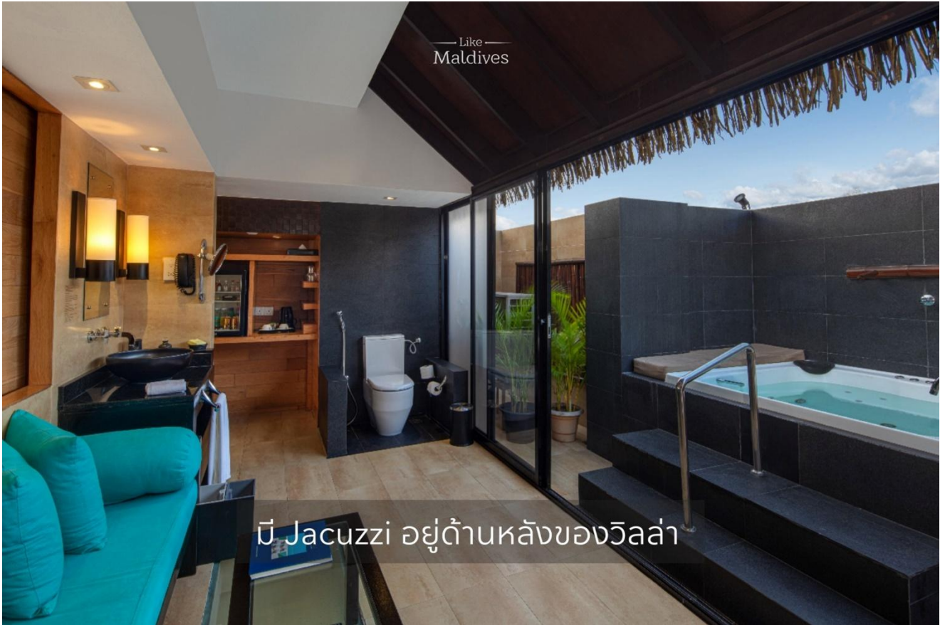
มี Jacuzzi อยู่ด้านหลังของวิลล่า