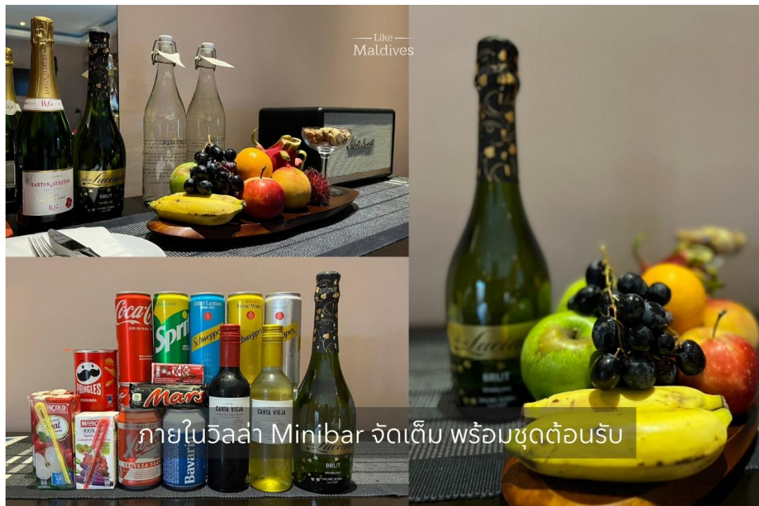
ภายในวิลล่า Minibar จัดเต็ม พร้อมชุดต้อนรับ