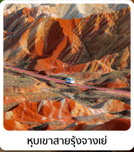
ภูเขาสายรุ้งจากเขี่ย