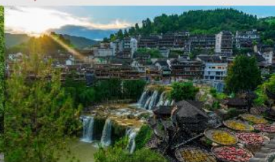
หมู่บ้านโบราณฝูหรงเจิ้น

*ทางบริษัทฯ ขอสงวนสิทธิ์ในการสลับโปรแกรมทัวร์ตามความเหมาะสมขึ้นอยู่กับสถานการณ์หน้างาน โดยคำนึงถึงผลประโยชน์ของลูกค้าเป็นสำคัญ