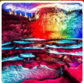
ถ้ำเก้าเทพ