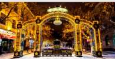
ถนนคนเดินจงหยาง