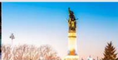
อนุสาวรีย์ผึ้งหง