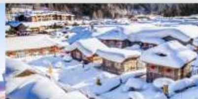
หมู่บ้านหิมะ

*ทางบริษัทฯ ขอสงวนสิทธิ์ในการสลับโปรแกรมทัวร์ตามความเหมาะสมขึ้นอยู่กับสถานการณ์หน้างาน โดยคำนึงถึงผลประโยชน์ของลูกค้าเป็นสำคัญ