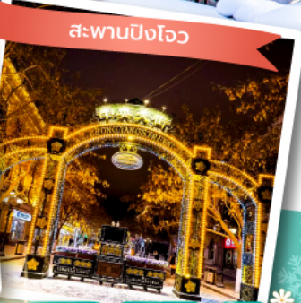
สะพานปิงโหว