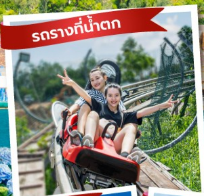
รถรางที่น้ำตก