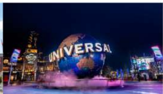
ยูนิเวอร์เซล ปักกิ่ง รีสอร์ท