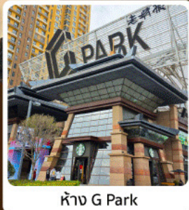
ห้าง G Park