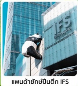
แพนด้ายักษ์ป็นตึก IFS