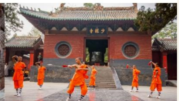
ชมโชว์กังฟูเล่าหลิน

*ทางบริษัทฯ ขอสงวนสิทธิ์ในการสลับโปรแกรมทัวร์ตามความเหมาะสมขึ้นอยู่กับสถานการณ์หน้างาน โดยคำนึงถึงผลประโยชน์ของลูกค้าเป็นสำคัญ