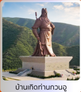
บ้านเกิดท่านกวนอู