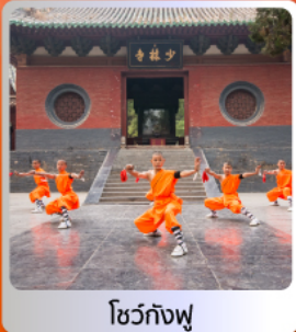
โชว์กังฟู

อาหารมื้อพิเศษ บุฟเฟ่ต์ สุกี่หม้อไฟ เปิดปิกกิ้งซือาน