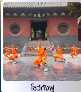
โชว์กังฟู