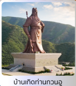
บ้านเกิดท่านกวนอู

อาหารมื้อพิเศษ บุฟเฟ่ต์ สุกี่หม้อไฟ เปิดปิกกิ้งซีอาน