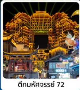
ตึกหอคจรรย 72