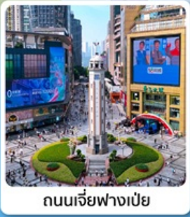
ถนนเจี่ยฟางเป่ย์