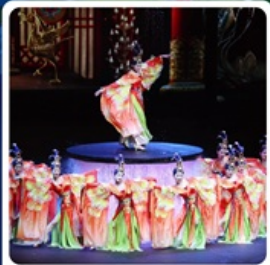
โชว์ FOSHAN QIANGQING