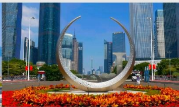
จัตุรัสฮัวเจิง

*ทางบริษัทฯ ขอสงวนสิทธิ์ในการสลับโปรแกรมทัวร์ตามความเหมาะสมขึ้นอยู่กับสถานการณ์หน้างาน โดยคำนึงถึงผลประโยชน์ของลูกค้าเป็นสำคัญ