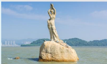
จูไห่พีชเชอร์เกิร์ล(หวิหนี่)