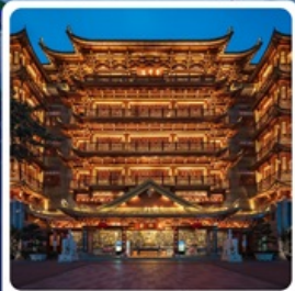
วัดต้าฝื่อซื่อ