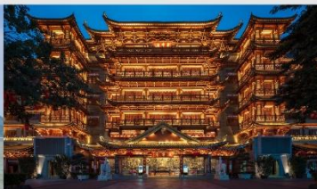
วัดต้าฝอซื่อ