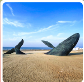
วาฬฟูดเดียว