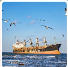
ซากเรือลิวอิส