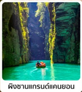
ผิงชานแกรนด์แคนยอน