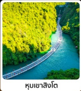
คุบเขาสิงโต

โวลเก้! บินตรงลงเอินซือ เกียวเอินซือเน้นจ้ดเต็มท้วเมือง คุบเขาสิงโต ผิงชานแกรนด์แคนยอน อุกยานจันลี่ชาน