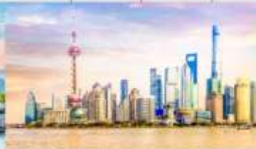
หาดไว่ถาน