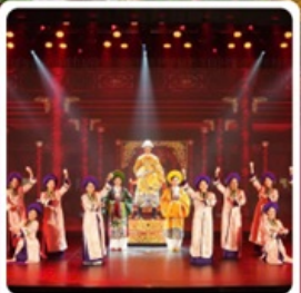
The Heritage Show